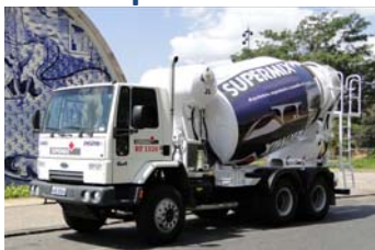
Supermix Concreto S.A. - Brasil Fcso Mativos: "Cidade Administrativa" Presidente Tancredio Neves, Belo Horizonte, Brasil"