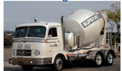
Supermix Concreto S.A. - Brasil Marca: Mercedes Benz - Modelo: 1961